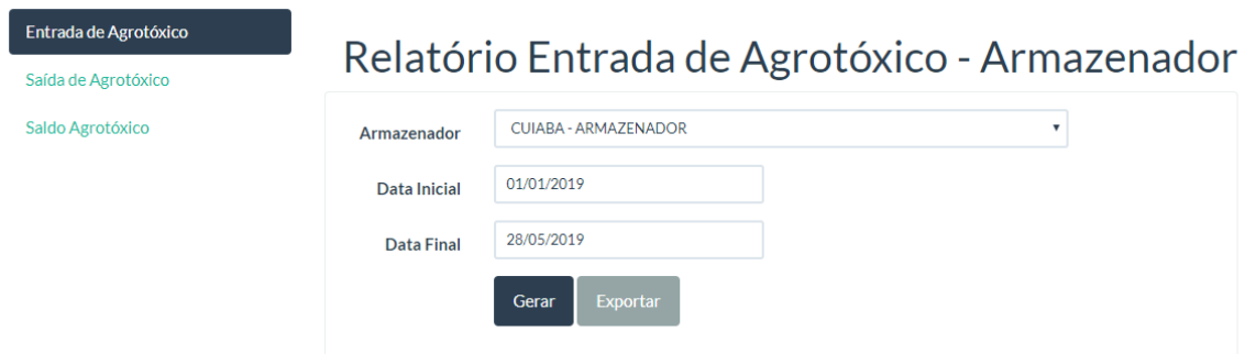
Figura 5: Tela Relatório de entrada de Agrotóxico - Armazenador

Clique em Gerar se deseja o relatório em formato PDF ou em Exportar se deseja o relatório em formato .xlsx