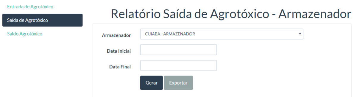
Figura 6: Tela Relatório de Saída de Agrotóxico - Armazenador

Clique em Gerar se deseja o relatório em formato PDF ou em Exportar se deseja o relatório em formato .xlsx